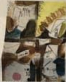
Obra da artista Mirta Caccaro, da Itália

Essas exposições com obras compartilhadas acontecem em todo o mundo e são chamadas de "Convocatória". Elas podem ou não ter um tema. O artista convida outros através de grupos na internet para participarem e recebem uma enxurrada de envelopes contendo verdadeiras