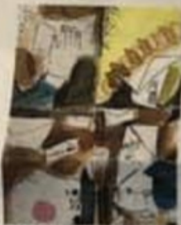
Obra da artista Mirta Caccaro, da Itália

Essas exposições com obras compartilhadas acontecem em todo o mundo e são chamadas de "Convocatória". Elas podem ou não ter um tema. O artista convida outros através de grupos na internet para participarem e recebem uma enxurrada de envelopes contendo verdadeiras